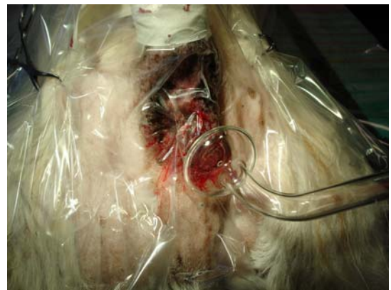
perineale Fisteln beim Terrier