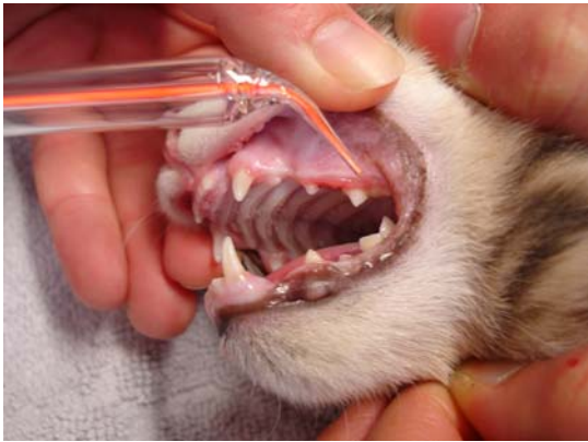
Stomatitis Gingivitis bei der Katze