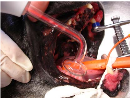
Epuliden beim Boxer